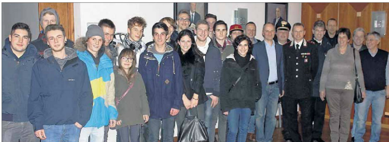
Knapp 20 Jugendliche nahmen gemeinsam mit Gemeindevertretern und Ordnungshütern an der Jungbürgerfeier im Aurer Rathaus teil (im Bild).

und Pflichten in Bezug auf das aktive und passive Wahlrecht und erläuterte den Aufbau der Gemeinde. Vor allem betonte Pichler die Eigenverantwortung, die jeder Jugendliche mit dem Erreichen der Volljährigkeit übernehme. Ebenfalls wurden die verschiedenen Dienste der Gemeinde und die Aufgaben der