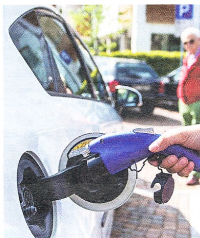
Tag des Dorfes: Am Sonntag geht's um die Energie.

Ohne Energie geht gar nichts. Ausgehend von dieser Tatsache will der Bildungsausschuss Auer in Zusammenarbeit mit zahlreichen anderen Vereinen und Institutionen auf dieses Thema aufmerksam machen. Als Datum wird bewusst der „Tag des Dorfes“ gewählt, welcher in Vergangenheit stets von mehreren Vereinen als Rahmenprogramm rund um den traditionellen „Suppenonntag“ des KVV gestaltet wurde. Für heuer stellt der Bildungsausschuss den Tag des Dorfes unter das Motto „Auer und die Energie“.