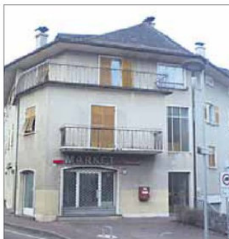
Das Haus befindet sich neben der öffentlichen Bibliothek und dem Hauptplatz.