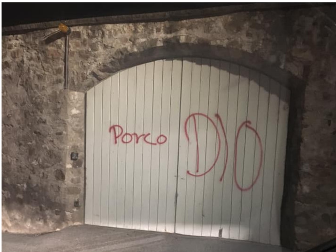
• La bestemmia sulla porta della Parrocchia di Ora dopo i bagordi della notte di Halloween

non ci sono altri siti sensibili. Se mettessimo una telecamera lì dovremmo tappezzare tutto il Comune. E non avrebbe senso».