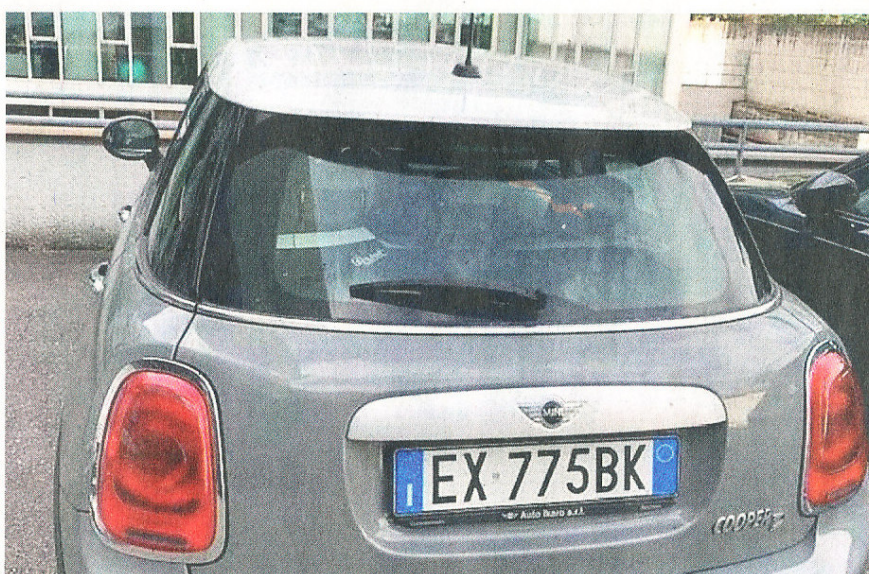
• La MINI Cooper D 5 porte rubata ad Ora lo scorso fine settimana