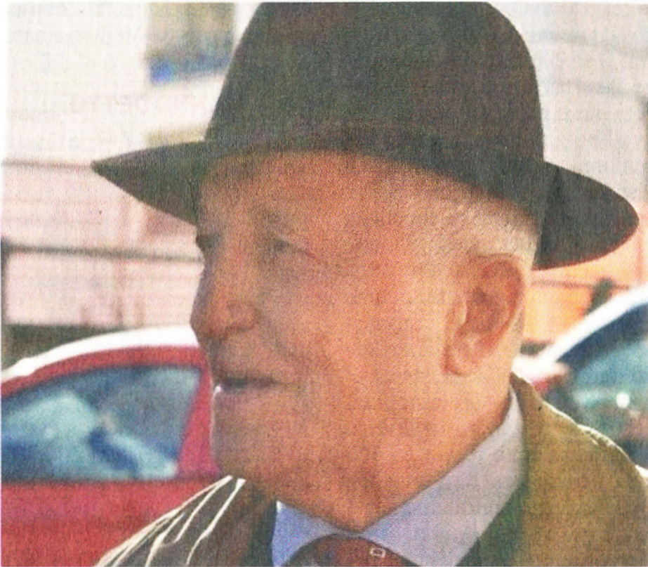
• Giuseppe Sgarbossa, presidente biblioteca italiana dal 1994 al 2019