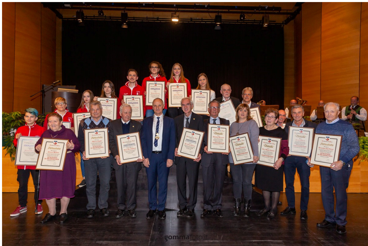
• Foto di gruppo per i premiati in occasione della «Giornata del volontariato» di Dra