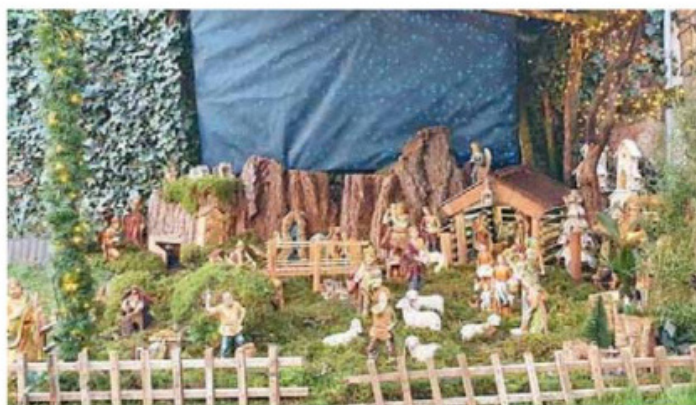
• Ci sono il panettiere che inforna il pane e il boscaiolo che taglia la legna