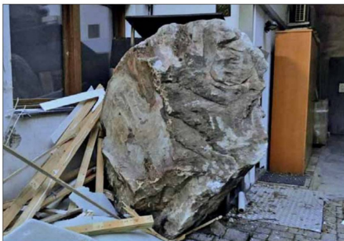
Im Bild der rund 3 Kubikmeter große Felsbrocken, der an der Fassade eines Betriebsgebäudes im Gewerbegebiet Lahn zu stehen kam. Martin Feichter