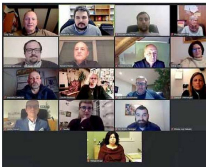
• Un momento del consiglio comunale a distanza a Ora