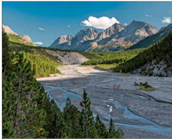
Das Bild „Valle del Gallo“ von Luca Ronchi landete auf Platz 3. Nationalpark

Aus den vielen Fotos hat die Jury hervorragende Schnappschüsse auf den ersten 3 Plätzen – also jenseits der Einzelkategorien – folgendermaßen gereiht: das Spiel von 2 jungen Hermelinen mit einer Blüte (Valter Pallaoero aus Auer) erhält den ersten Preis; die neue Welle der Makrofotografie, welche eine Libelle mit der Bezeichnung Brautjungfer in eine geometrische Abstraktion verwandelt (Giuseppe Bonali, zweiter Preis) und schließlich die Wildnis der Valle del Gallo im Nationalpark Stilfser Joch (Luca Ronchi, dritter Preis).