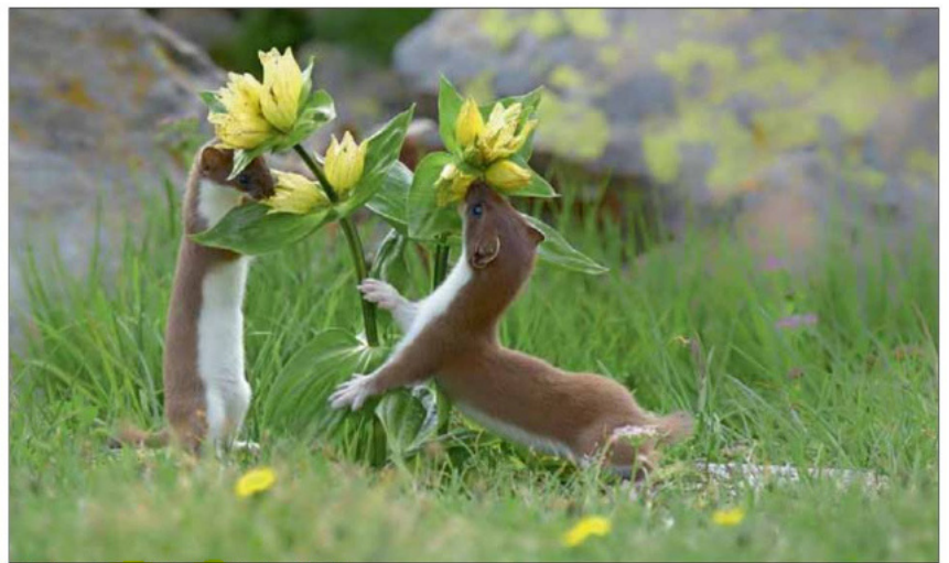
Das allgemeine Siegerfoto ist „Giocando si cresce“ von Valter Pallaoero aus Auer.

@ Informationen unter www.fotografareilparco.it