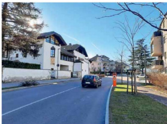
• Il conta traffico servirà anche a rilevare la velocità, ma niente multe

profondamente le abitudini soprattutto dei residenti ma che è stato apprezzata anche dai turisti, come si è avuto modo di constatare nei mesi passati.