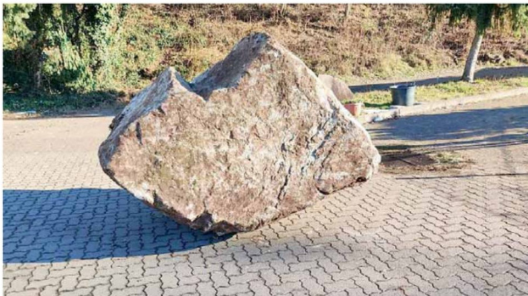
• Il grande masso precipitato nel parcheggio della pizzeria Nussbaumer