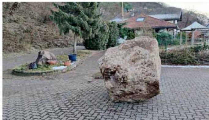
• L'enorme masso è caduto a pochi metri dalla Statale 12