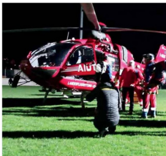
• Un elicottero dell'Aiut Alpin in azione di notte □

«La realizzazione dell'elipporto - conclude il sindaco Martin Feichter - fa parte degli interventi inseriti nel Dup, il nostro documento unico di programmazione».