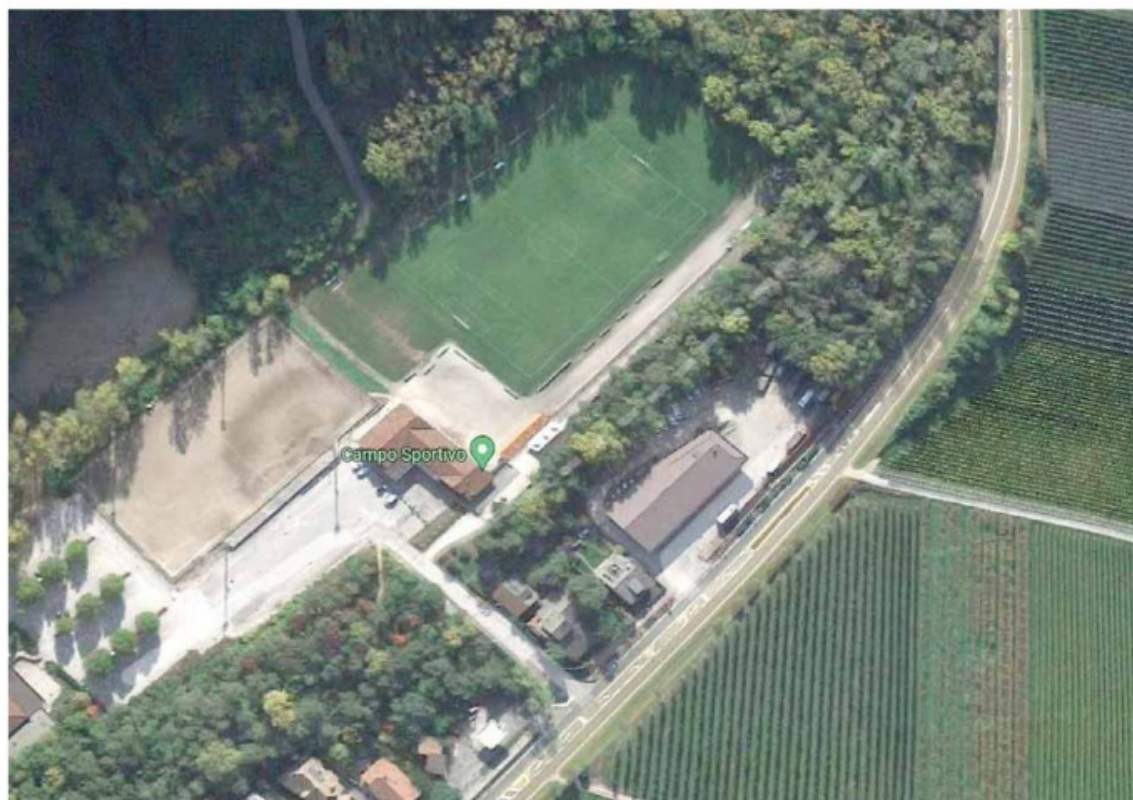
• L'area del centro sportivo Rio Nero-Schwarzenbach di Ora □

L'area è a poca distanza dall'uscita d'emergenza della galleria