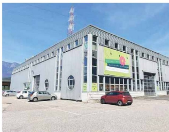
• La struttura di via Nazionale a Ora