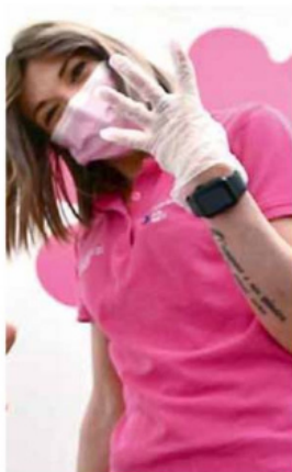
• Per gli over 80 c'è la quarta dose