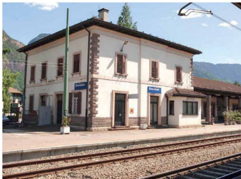
• La stazione ferroviaria di Ora tornerà presto sotto il controllo delle telecamere

Con le telecamere spente, come avevamo già scritto lo scorso aprile, il rischio di prestare il fianco a una recrudescenza della microcriminalità, ladruncoli soprattutto, era